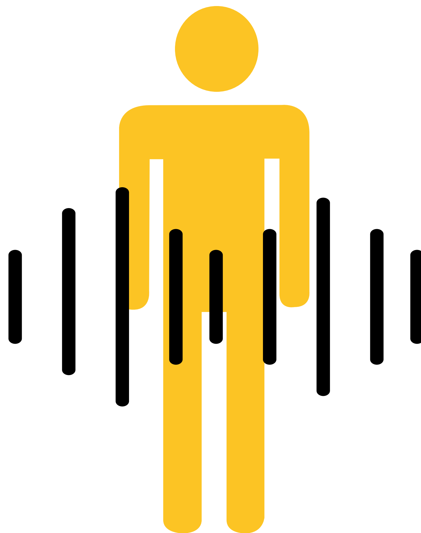
TEMBLANDO CON ESCALOFRIOS