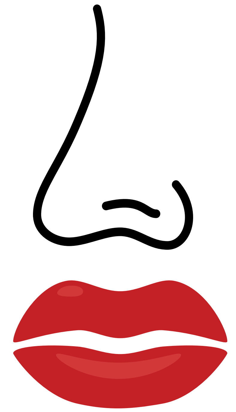
PÉRDIDA DE SABOR/OLFATO